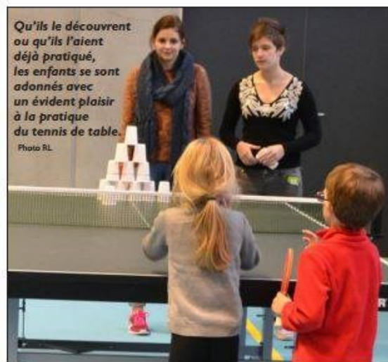
Qu'ils le découvrent ou qu'ils l'aient déjà pratiqué, les enfants se sont adonnés avec un évident plaisir à la pratique du tennis de table.

Dans le cadre de l'opération « Les belles rencontres », initiée par le conseil général, des enfants, séparés de leur famille et placés sous sa responsabilité, sont venus s'initier au tennis de table dans le tout nouveau gymnase Bomersheim de la ville.