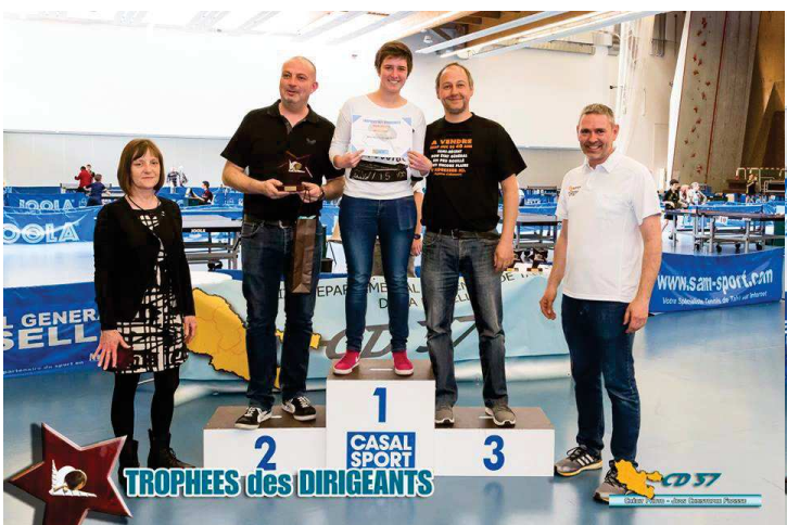
Comité de l'année : Maizières-lès-Metz TT