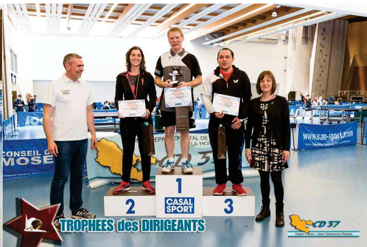
Action de développement de l'année : ACAL TT